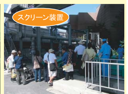
スクリーン装置は、用水路に流れてきたゴミを取り除く施設です。