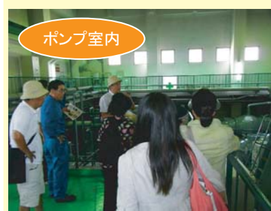
7台のポンプにより、1分間にプール3杯分の水を排水することができるそうです。

この施設は、大雨の時に雨水が街に溢れないように城北川に雨水を流すなどの機能を持っています。