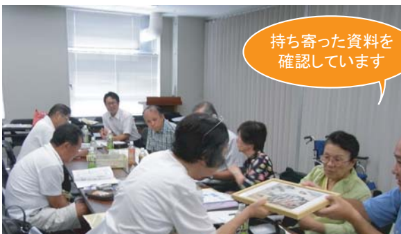
持ち寄った資料を確認しています