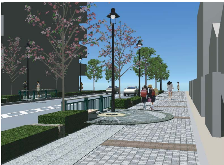
イメージCG 鉄道の車輪をモチーフとした広場