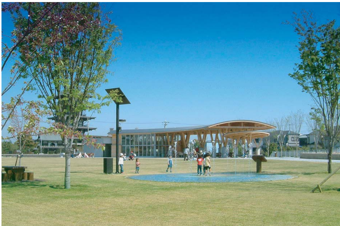
子供達に人気のポップアップ噴水

パークセンターは、第8回木材活用コンクール加工センター理事長賞を受賞、また公園では、ランドスケープライティングアワード2005において地区優秀賞を受賞している。