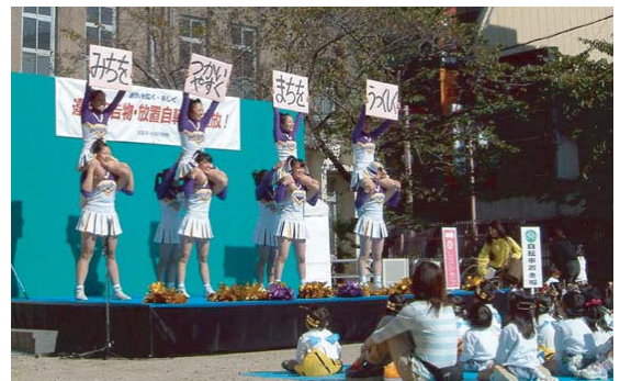
パトロール応援チアリーディングパフォーマンス