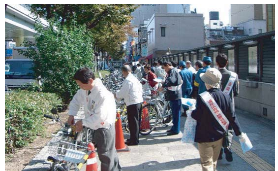
道路クリーンアップ合同パトロール