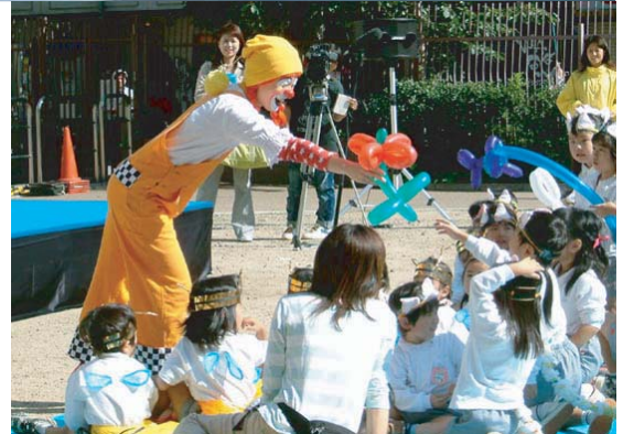
アトラクション「ままれのパルーンパフォーマンス」