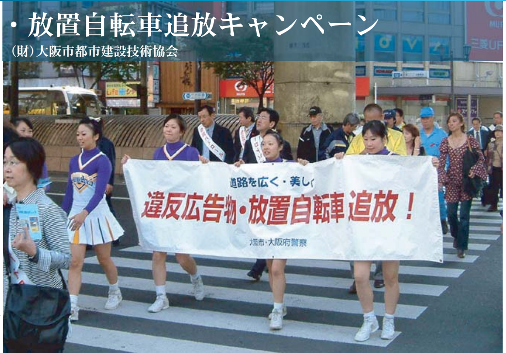
パトロールの様子

まちの美化を目的として、地域と行政が一体となって違反広告物や放置自転車の追放を啓発するキャンペーンイベントでは、ステージでのイベントプログラム、地域周辺のパトロールなどを実施。テレビ放映や新聞など、メディアの注目を集めた。