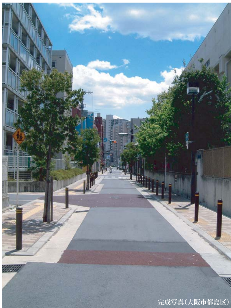
完成写真(大阪市都島区)