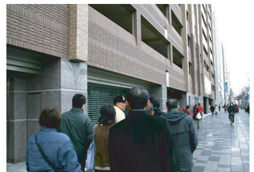
マップづくりワークショップ(まち歩きの様子)