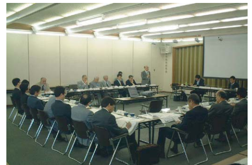
御池沿道関係者協議会